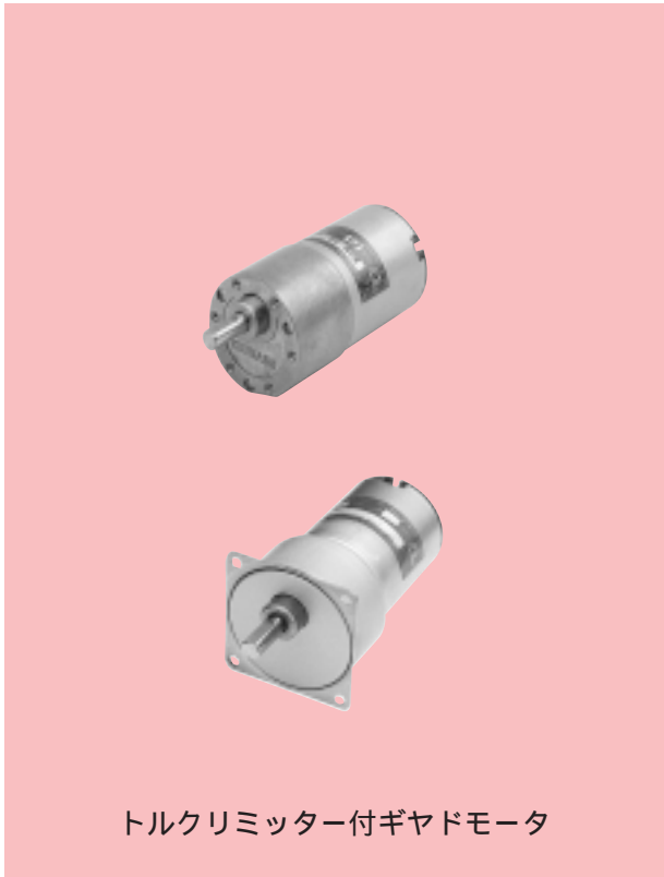
トルクリミッター付ギヤドモータ